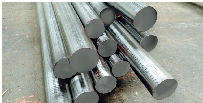
Toolox: Toolox in round bars V1 - 2015 - Halledo

Grâce à son haut niveau de propreté inclusionnaire et à son état de surface exceptionnel, l'acier Toolox est la réponse au phénomène de fatigue. Lorsqu'une résistance à l'usure encore plus accrue est nécessaire en surface, il est possible de réaliser sur l'acier Toolox un traitement par nitruration et/ou par DPV. De plus, Toolox peut également être utilisé pour des applications qui exigent des températures élevées jusqu'à 590°C.