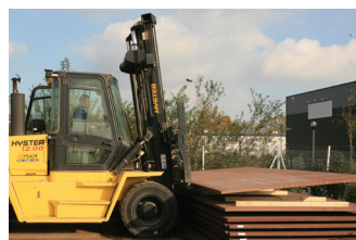
Important stock Raex® et Optim® permettant une forte réactivité.

• Enfin la gamme d'acier balistique Ramor®, quant à elle, est conçue pour